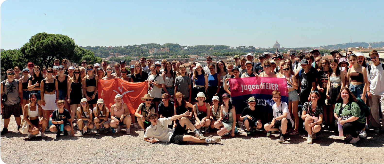
Giardino degli Aranci, 2023

Achtung! Dies ist keine „Badereise“! Es gibt ein touristisches Programm! Die Teilnahme am Programm und am Ausflug nach Florenz ist Pflicht. Auf Grund der örtlichen Gegebenheiten können wir leider keine speziellen Ernährungsformen berücksichtigen. (Vegetarisch/Vegan oder ähnliches)