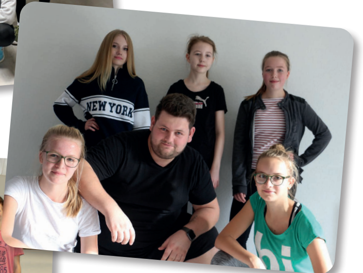
Tanzkurs, Foto: H.-L. Beyerling