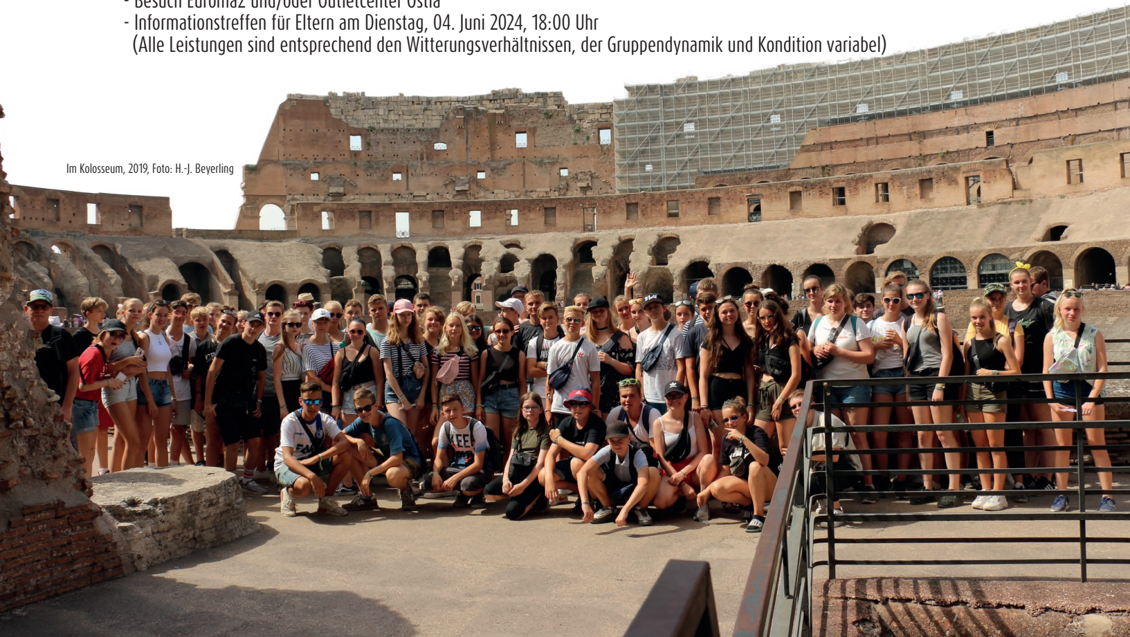
Im Kolosseum, 2019, Foto: H.-J. Beyerling