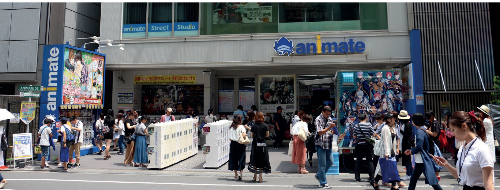
Animate Street, Tokyo 2017