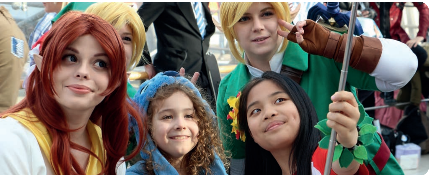
Buchmesse Leipzig 2017