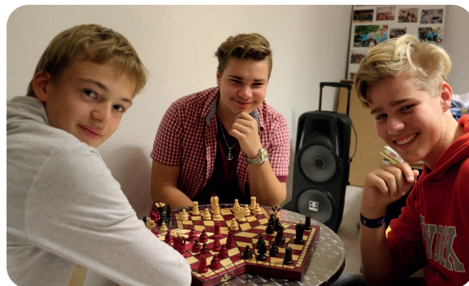
Nacht der Gesellschaftsspiele 2018