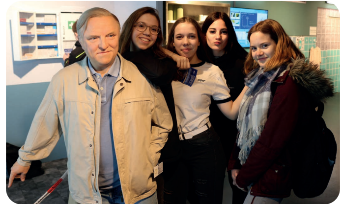
Madame Tussauds Berlin 2019, Foto: H.-L. Beyerling

PS: C8 auch für Eltern/Familie geeignet!