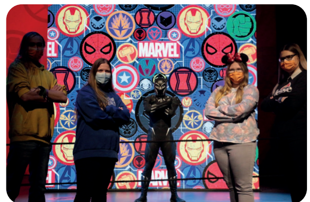
Black Panther in Disneyland Paris 2022

Achtung: Bei dieser Veranstaltung kann es auf Grund der großen Nachfrage zu weiteren Terminen kommen. Leider können wir dabei keine Wunschtermine erfüllen, haltet euch also bitte alle in Frage kommenden Termine frei.