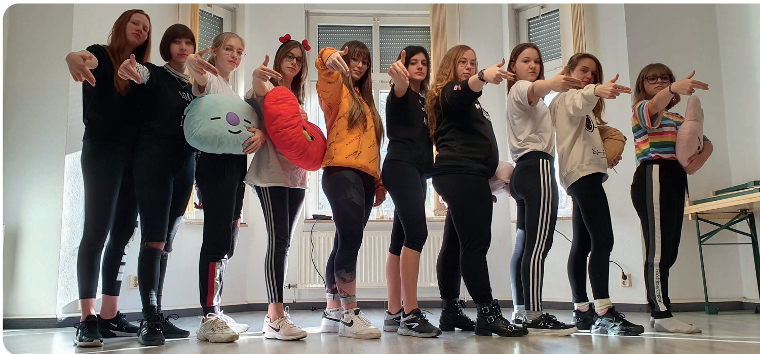
K-Pop - Tanzwochenende